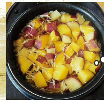
ストーブで 焼き芋にも